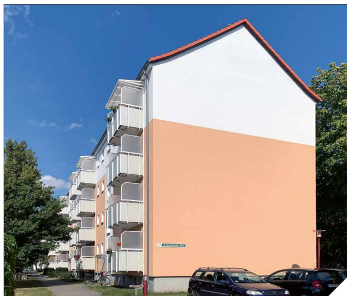
G-Sandtner-Straße 8, nachher